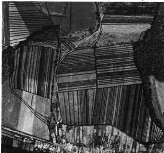
Príklad: stav pred pozemkovými úpravami