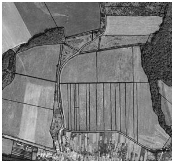
stav po pozemkových úpravách